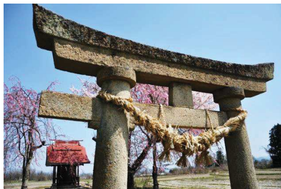
参道の中ほどに建てられた凝灰岩製の鳥居。弘化三丙午歳(1846年)三月十三日と刻まれています。この鳥居に皆で作ったしめ縄を毎年奉納しているそうです。

護るのは、代々川辺町内の方々が、順番に「用番」と呼ばれる2人が1年間世話をします。例えば、祭りの前に参道の草を刈ったり、12月中旬に行うしめ縄作りを取り仕切り、天神社へ奉納したり、元日参りに来る人達のために、参道の雪かきもするそうです。また、毎年元日参りに鏡餅をお供えする方もいるとお聞きし、町内の方々がいかに大事に護