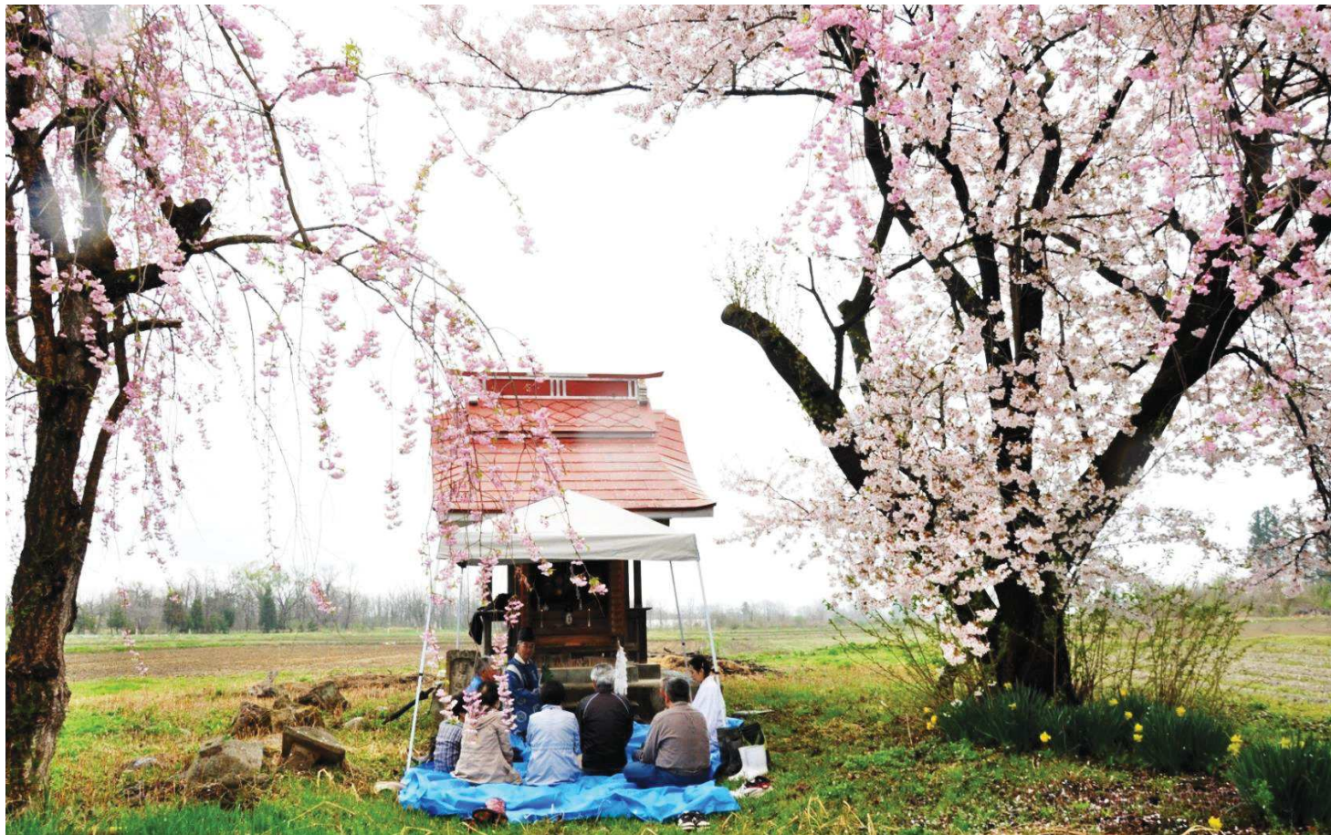
満開の桜が小雨に濡れ、鮮やかさを増した花びらがハラハラと散り行く中、白山神社の鶴巻宮司が祝詞(のりと)あげを行いました。鶴巻宮司にこうしてお祭りが他でも行われているか伺ったところ、ここと六郷の長橋地区だけだとのこと。残していきたい貴重なお祭りです。