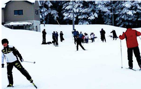
蔵王坊平クロスカントリースキーコースにて、コーチと共 にのびのびと練習に励むFACの子ども達。(上写真同)

るように思えました。 そんな雪のない状況が続く中でも大会に向けて、土曜日の午前中は体育館にて基礎トレーニングや体力づくり、日曜日は雪がある所を求め、蔵王の坊平クロスカントリースキーコース等にて練習を重ねています。