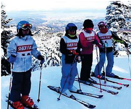
天元台スキー場にて、お揃いのピブスを付け気合十分！絶景をバックにパチリ。(右下写真同)

日曜日は、天元台スキー場を中心に練習しておりますが、他の地区のチームも同じで、練習が出