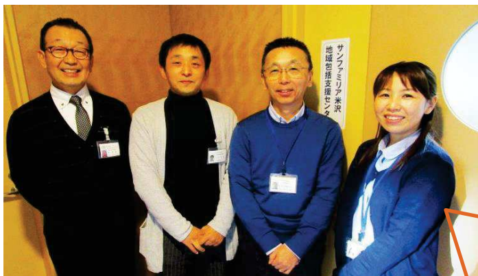
↑ サンファミリア米沢地域包括支援センターの皆さん 左から