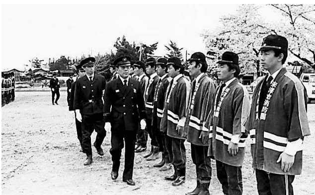
↑今から41年前、消防団第七分団の皆さんが、塩井小学校グラウンドにおいて真剣な面持ちで演習に臨んでいる様子です。

塩井地区の懐かしい写真を掲載するこのコーナー。今回は、「昭和54年春季消防演習」を紹介します。