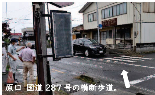
原口 国道 287 号の横断歩道。