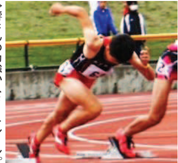
→響さんの力強いスタートシーン。

県中学校総合体育大会陸上競技大会 全日本中学校陸上競技選手権大会県予選会 3年男子100M、共通男子200M 第2位