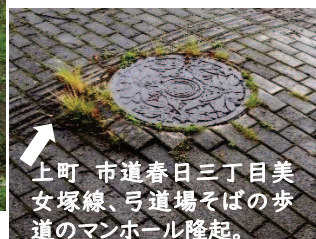
上町 市道春日三丁目美女塚線、弓道場そばの歩道のマンホール隆起。