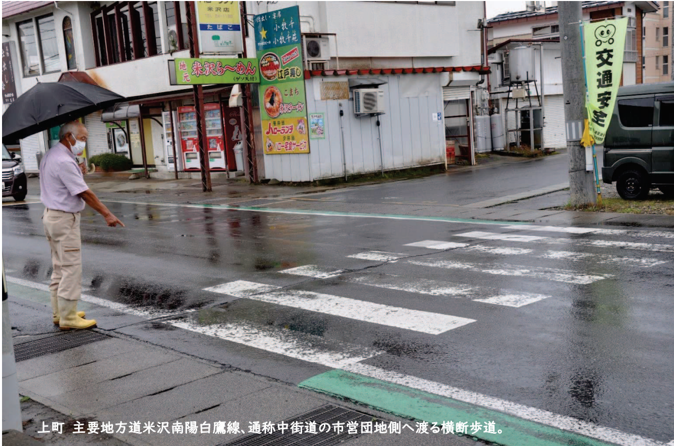
上町 主要地方道米沢南陽白鷹線、通称中街道の市営団地側へ渡る横断歩道。