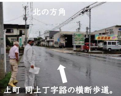
上町 同上丁字路の横断歩道。