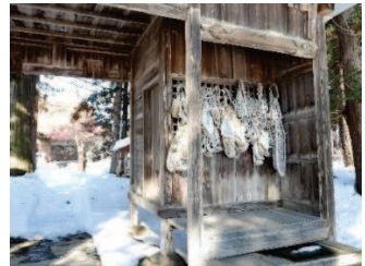
仁王門。素朴な造りにも威厳が漂う。