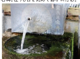
泉水。冷たい水はつきることなく豊富に流れ、水音のみ響きます。