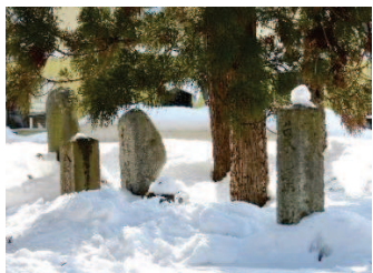
石碑。在りし日を刻んで静かに佇む。