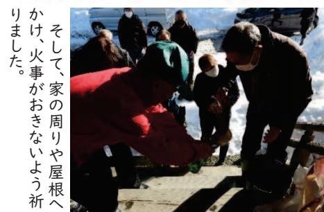
そして、家の周りや屋根へかけ、火事がおきないように祈りました。

清められた水は、町内ごとにそれぞれが持ち寄った容器へ入れ、持ち帰るのが当たり前のことでした(左)。