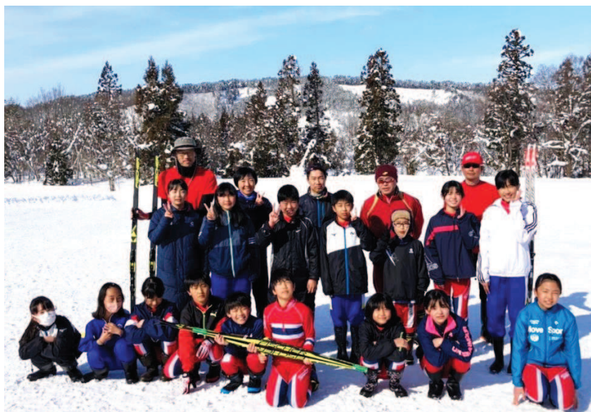
レース後の一枚。力を出し切り、みんな晴れやかな表情です。

目標がない状況で始めた今シーズンでしたが、この「米沢クロカンフェス」で滑ることの楽しさと練習の成果を実感することが出来ました。