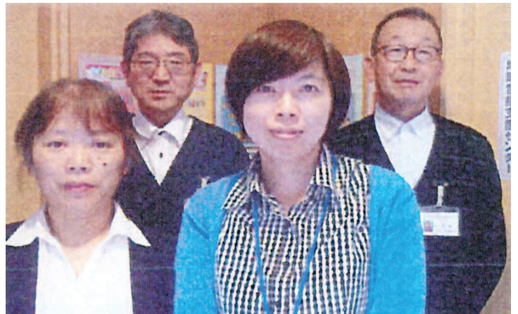
写真/サンファミア米沢地域包括センターだより令和4年春号より

地域包括支援センターとは、米沢市の委託を受けた公的機関として、高齢者の方々が可能な限り住み慣れた地域で安心した生活を送られるように支援を行う総合相談窓口です。 ◇ 当塩井地区の担当は、「サンファミア米沢地域包括支援センター」となります。 ◇ 右にご紹介する方々が現在の担当者です。 「介護保険のサービスを利用したい、一人暮らしが大変になってきた、足腰が弱ってきて今後の生活が心配、高額な商品の購入を勧められた、高齢の家族が認知症かもしれないなど様々な悩みをお気軽にご相談下さい、私達が伺います。」とのこと。