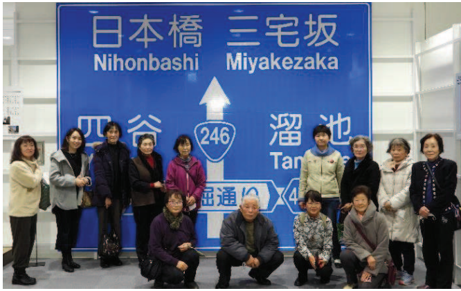
実寸大の標識の前で。普段何気なく見ていた標識でしたが一文字ずつ手作業で貼り付けていることにビックリ！素晴らしい職人技です。

12月日（金）、3年ぶりに『大人の社会科見学2022』を開催しました。 今回は、栃木県那須町にある全国の道路標識を製造している(株)アークノハラ那須工場と那須とりっくあーとぴあを見学。写真とともに紹介します。