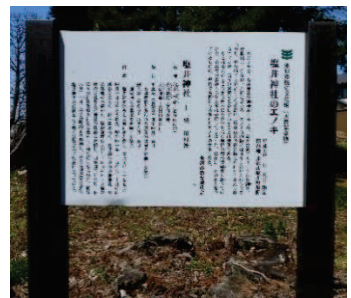
米沢市指定天然記念物となった工ノキを紹介する看板は、今もそのまま残されています。

それから年月が経ち、落雷等で倒木の恐れが出てきたため、令和元年8月27日、米沢市教育委員会へ指定解除の届出を提出。同年9月13日に指定解除され、その後根元を残り伐採されました。 令和5年4月、かつての御神木「塩井神社の工ノキ」の根元から新たな若枝『ひこばえ』がすくすくと育ってきていることがわかりました。 それに伴い、米沢市教育委員会から、塩井神社総代長へ新たな提案がなされています。後編として次回ご紹介いたします。