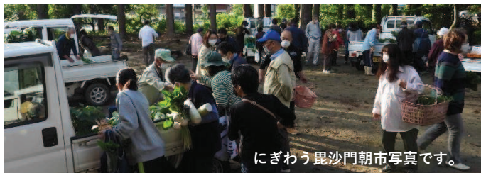
にぎわう毘沙門朝市写真です。

期間 5月7日(日)～11月19日(日) 時間 午前6時～(毎週日曜日) 野菜・なめこ・お餅・加工品(漬物)・切り花・野菜苗など、取り揃えてお待ちしておりますので、ぜひお買い求め下さい。 なお、マイバック持参をお願いいたします。 また、出店会員も募集していません。 朝市の石原会長までご連絡下さい。 ☎23-7362