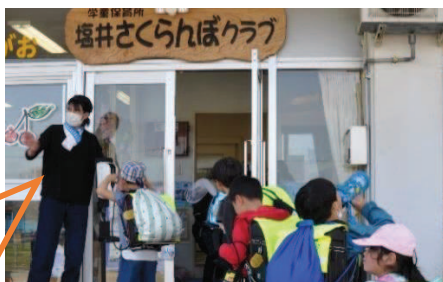
①子ども達は「ただいまー」と集団下校でさくらんぼクラブへ帰ってきます。指導員の皆さんが笑顔で出迎えてくれます。