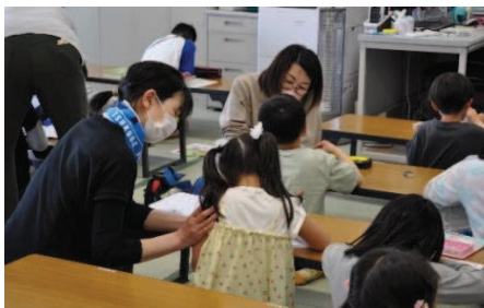
④1年生の宿題は、ひらがな「ね」の書き方練習。指導員の方々がしっかり見てくださいます。他の学年も計算や漢字練習に取り組んでいました。