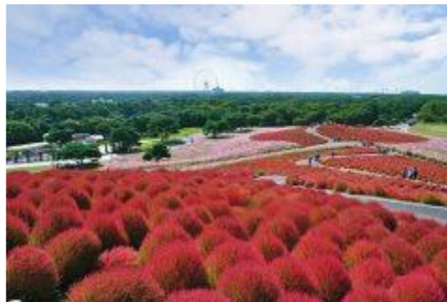
国営ひたち海浜公園公式サイトより。みはらしの丘のコキア。緑から赤へ変わっていく姿は圧巻です。