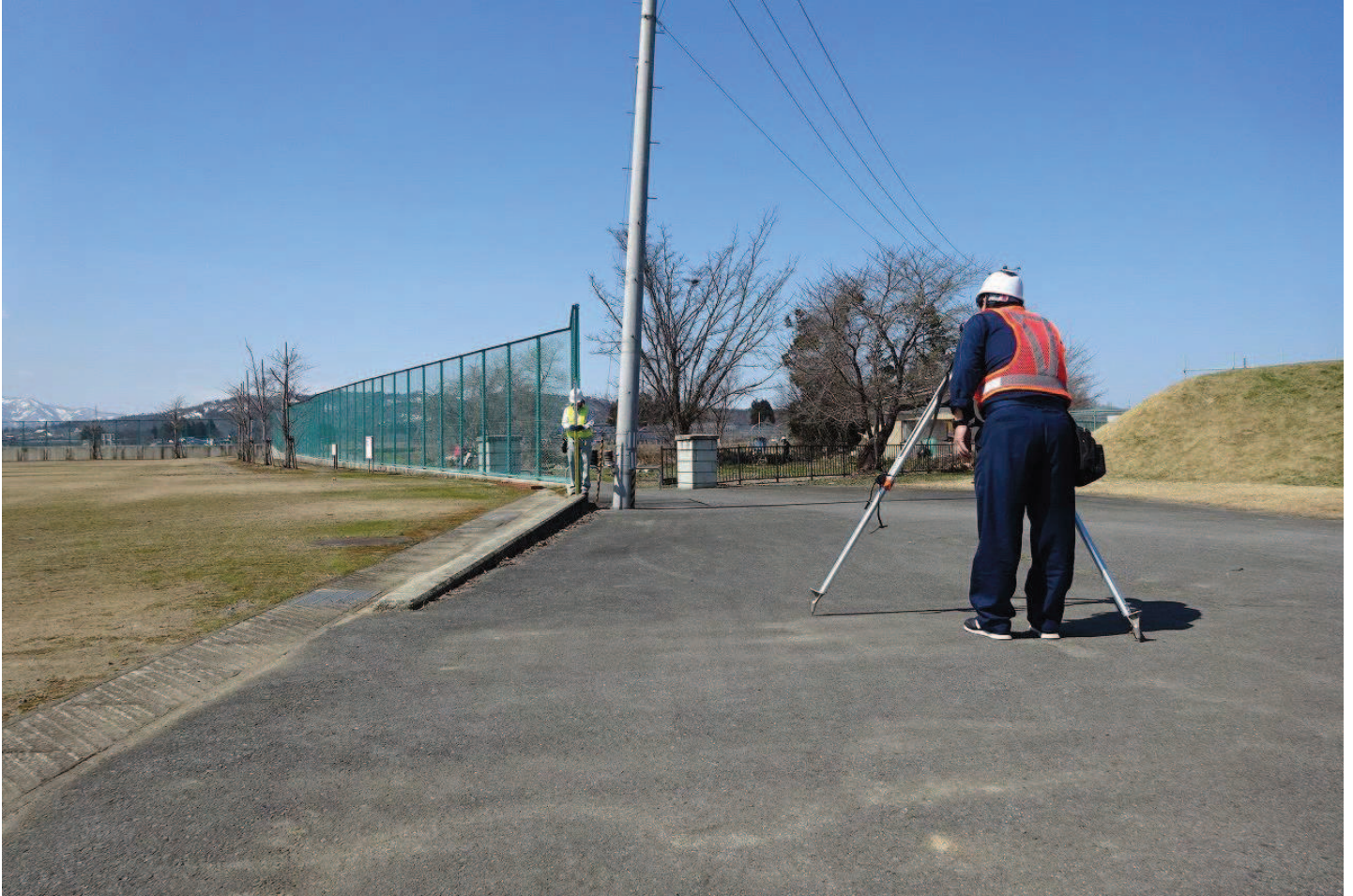
塩井小学校グラウンドとわかくさ山間の通路を測量中。