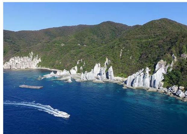
仏ヶ浦(ほとけがうら)の遊覧風景。奇岩の数々は見ごたえ十分。