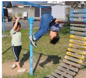
かっこよく逆上がりを見せてくれた元気いっぱいな1年生。

塩井小学校の児童昇降口側に開所している学童保育所「塩井さくらんぼクラブ」(高橋庄八会長)には、今年度9名の1年生が新たに入学し、総勢39名となりました。(長期休暇時の登録者含む)