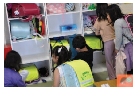
②帰って来たら、自分の荷物をロッカーへ。1年生も上手に一人で片付けていましたよ。