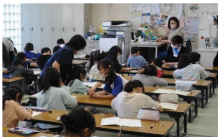
③下校後すぐに宿題を済ませます。一斉下校だったこの日は、全学年揃って机に向かっていました。