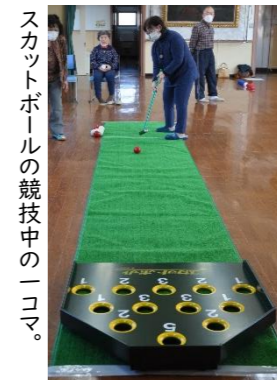
スカットボールの競技中の一コマ。