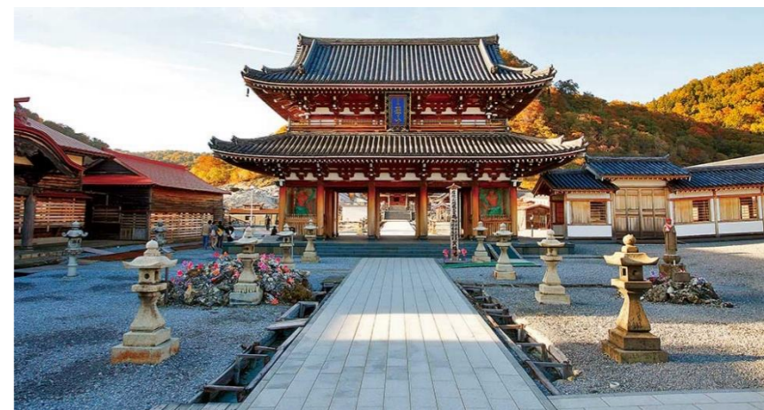
下北ジオパーク公式 HP(ホームページ)より。恐山エリア。恐山菩提寺の山門。

それから、東京オリ ンピックスタジアム(国立競 技場)や気象庁を見学。 茨城県ひたちなか市、開 面積約215ヘクタールにも 及ぶ国営ひたち海浜公園の コキアを鑑賞します。 丸々としたかわいらしい コキアが鮮やかに紅葉して、 みはらしの丘を真っ赤に染 め上げる様子はまさに絶景 です。一緒に行きませんか。