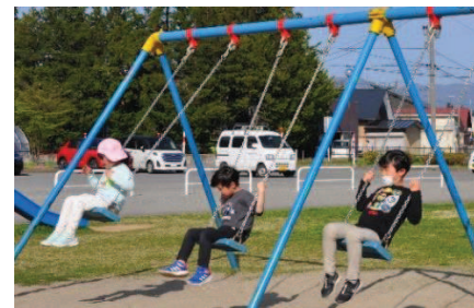
⑤宿題が終わると、みんなで元気に遊んだり、おやつを食べたりしておうちの方が迎えに来るのを待っています。