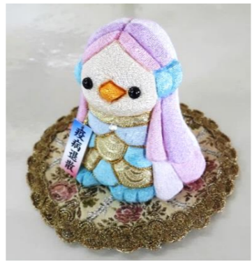
木目込み人形。あまびえ。