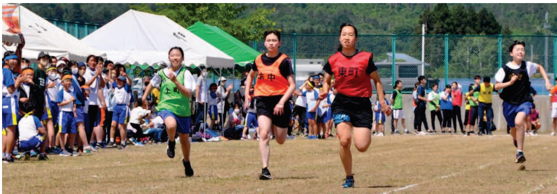
↑若さあふれる10代20代女子100M競走。スピード感のあるレースに、ギャラリーの皆さんも身を乗り出して応援です。