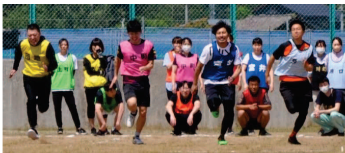
↑緊張感のある30代40代男子100M競走のスタートシーン。ゴールまで全力疾走の皆さんの走りは、これから走る皆さんも釘付けでした。