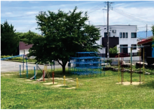
塩井小学校遊具。雲梯と鉄棒とジャングルジム等。

A：令和6年の春頃に撤去する予定ですので、それまでの間は利用できません。その後は遊具の一部をグラウンドに移設する方向で検討しております。