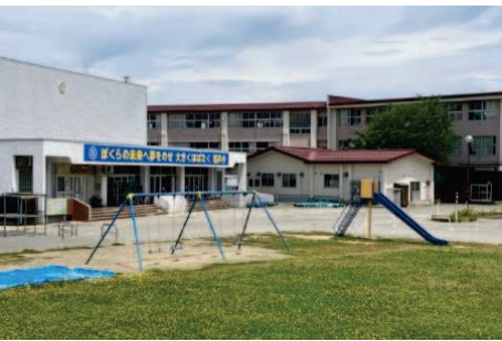
塩井小学校遊具。ブランコと滑り台。

Q：今年度はどんな影響がありますか？ A：8月中旬から約2〜3週間、小グラウンド(校庭)付近でボーリング調査を行う予定です。調査はバリケードを設置した上で作業員が常駐し、安全に十分配慮して行います。