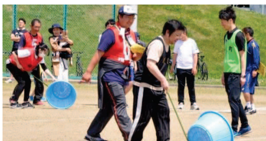
↑皆さん悪戦苦闘のザルころがし。そんな中スイスイっと1位に輝いたのは川辺チーム。

↑1体育協会を中心としたスタッフの皆さんの4年ぶりとは思えないスムーズな連携と進行に感謝です。 ↑5名の六中生もスタッフとして、大会を大いにサポートしてくれました。