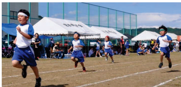
↑1年生も初めての運動会で元気いっぱい最後まで諦めず80Mを走り切りました。