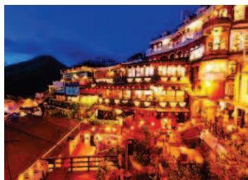
阪急交通社ホームページより。

赤い提灯が特徴的なレトロな雰囲気を出す「九份」。千と千尋の神隠しのモデルとしても知られています。