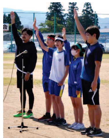
↑前回大会優勝宮井チームの皆さんによる元気な選手宣誓で4年ぶりの運動会がスタート！