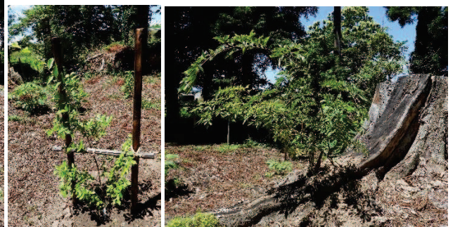
植樹式後の工ノキ2世2本(172 cmと125 cm)と手入れ後のひこばえ。6月19日撮影。

『巨木の幹は、大人数人が手をつないでも太く、見上げれば梢はひどく高い。密生した葉のために木の下は所々光の帯をつくり、昼なお緑の蔭で薄暗さを感じる。根は太く、地面から大きく盛り上がり、枝分かれましたひげのような細い先は縦横にうねる。』 かつての御神木「塩井神社の工ノキ」を語る言葉ですが、この3本の若枝の20年後にもそう語られていたら嬉しいですね。