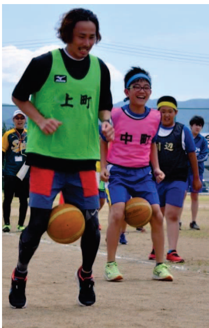
↑バスケットボールを足に挟み7人でリレーしていくカンガルーとびリレー。苦しいはずのレースですが選手たちはなぜか笑顔です！！