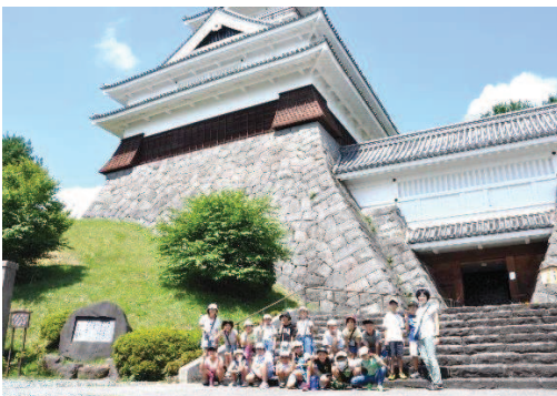
晴天の中そびえ立つ上山城前で。

辺りが暗闇で染まる中、周りは炎で明るくなり、童謡「アブラハムの子」の歌に合わせて皆で楽しく踊り、塩井小学校の校歌を斉唱しました。