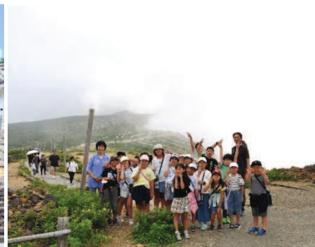
蔵王お釜は残念ながら霧で見えませんでした。山形市西消防署。大型の緊急車両の前で。