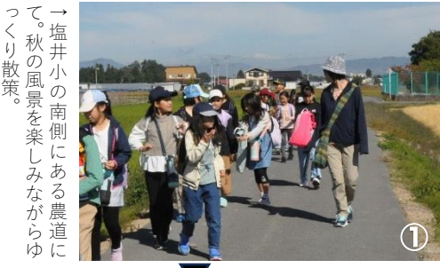
→塩井小の南側にある農道にて、秋の風景を楽しみながらゆっくり散歩。