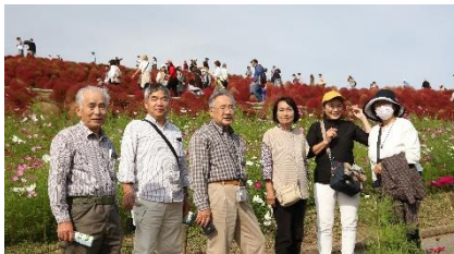
↑ひたち海浜公園では、コキアとコスモスをバックにパチリ。