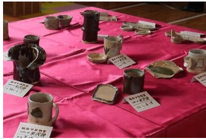
塩井少年教室。米沢焼の作品。