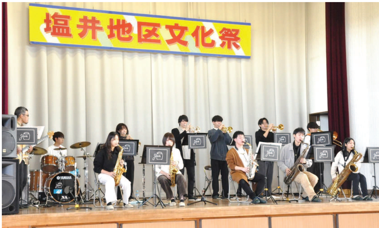
管楽器とギター、ドラムパーカッションを使った迫力のジャズを演奏してくれたのは若手ジャズグループ Big Band 「Jam」。 その後、「パプリカ」や「東京ブギウギ」など皆の良く知る楽曲を楽しく演奏してくれて、思わず手拍子も沸き起こりました。