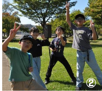
↑総合公園では、思いっきり体を動かして遊びました。すっかりお腹もペコペコに！