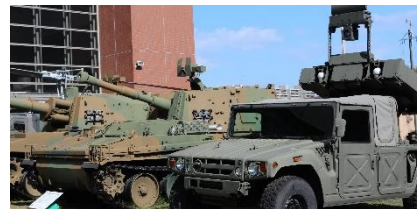
↑りっくんランドでは、迫力ある戦車の展示にワクワク。