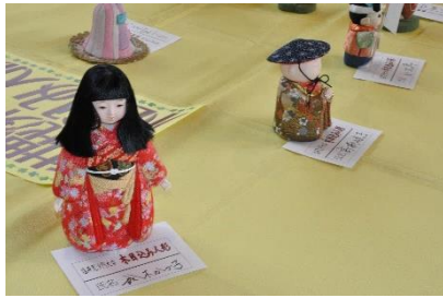
塩井昆沙門大学の木目込み人形。