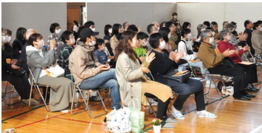
老若男女、幅広く久しぶりの生演奏を楽しむ皆さん。切れのある演奏で、皆さん心弾んで聴き入ってくれていたようでした。

4年振りに開催した塩井地区文化祭2023。10月29日(日)当日は、天候が荒れるとの予報が出たため、前日に急きょ出店を体育館内の会場へと変更することを決めて行いました。