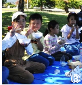
↑いも煮はおかわりする人がほとんど。みんなで食べるとおいしいね。