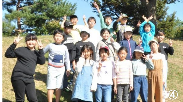
↑最高の秋晴れに恵まれ、身も心も満たされました！