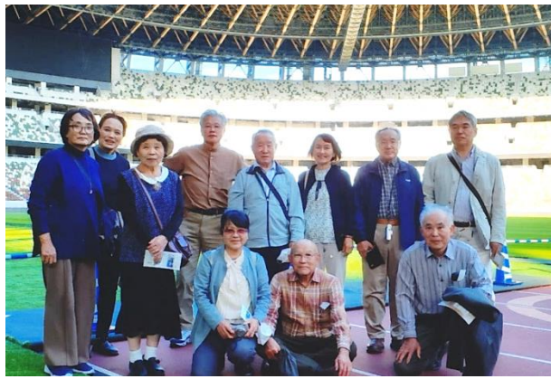
↑国立競技場にて。世界の名だたる選手たちが走ったトラックに立つ一行。スタジアムツアーも体験し、オリンピック東京2020大会で使用された聖火リレートーチや、選手たちが壁に書き残したサイン、スタンドからの眺めも圧巻でした。

秋の空がすっきりと晴れわたる、絶好の研修日和となった10月18、19日(水、木)、毘沙門大学では関東方面へ研修旅行に出かけました。今回は、埼玉県の朝霞駐屯地に併設された陸上自衛隊大型広報施設「りっくんランド」や、国立競技場ドーム、オリンピックスタジアム、コキアが見頃の国営ひたち海浜公園を見学。参加した皆さんの様子を写真と共にご紹介します。