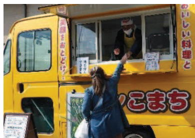
↑今回も塩井 de マルシェではおなじみの焼きたてピザとコーヒーのタントグラツェさん(左上)、お餅とおこわのおおくぼ福餅さん(右上)、各種ラーメンのキッチンこまちさん(左)が、来場者の皆さんのお腹を満たしてくれました！ どれもおいしかった～！