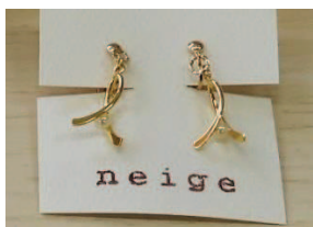
→ピアスやイヤリング、樹脂でできたブローチ等が並んだコーナー。大人かわいい小ぶりのデザインがステキでしたよ。