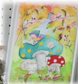
↑やわらかいタッチのイラスト額。インテリアとしてお部屋にあると、きっと癒されるはず！ ←ユニークなデザイン布で作られたアームカバーやコースター、ペンケース等の布小物たち。