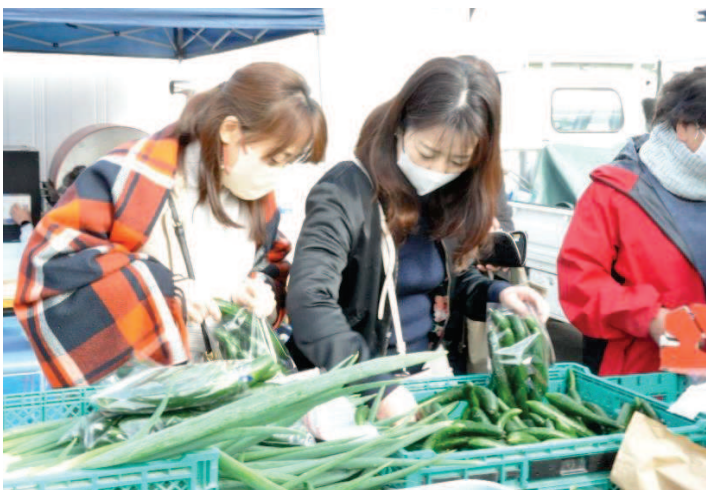
↑毘沙門朝市農家さんのマルシェ特別企画。きゅうりの詰め放題。皆さん楽しそうに夢中でビニール袋へ入れていました。瞬く間にきゅうりが減って行って、まだ始まったばかりなのに大丈夫かなと心配になるほど人気でした。

当地区のもう一つの秋のイベント、当コミセン自主事業「塩井deマルシェ」を11月12日(日)、開催いたしました。 この日は気温の低さや天候が危ぶまれましたが、開けてみれば開催時間中は穏やかな良い日和となり、大勢の方々が来場されました。