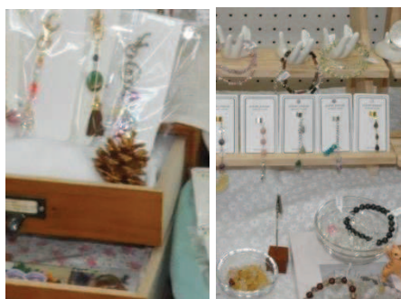
↑かわいいチャームや揺れるイヤーカーフ、パワーストーンのアームレット等、女子が好きなもので溢れています！