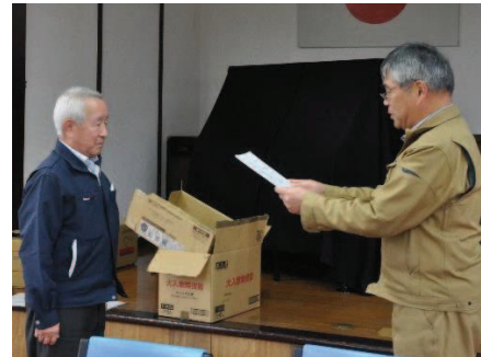
↑閉講式では、毘沙門大学長の金沢館長より修了証が受講生に手渡されました。