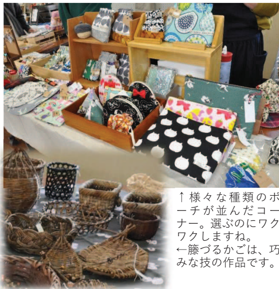
↑様々な種類のポーチが並んだコーナー。選ぶのにワクワクしますね。 ←籐づるかごは、巧みな技の作品です。