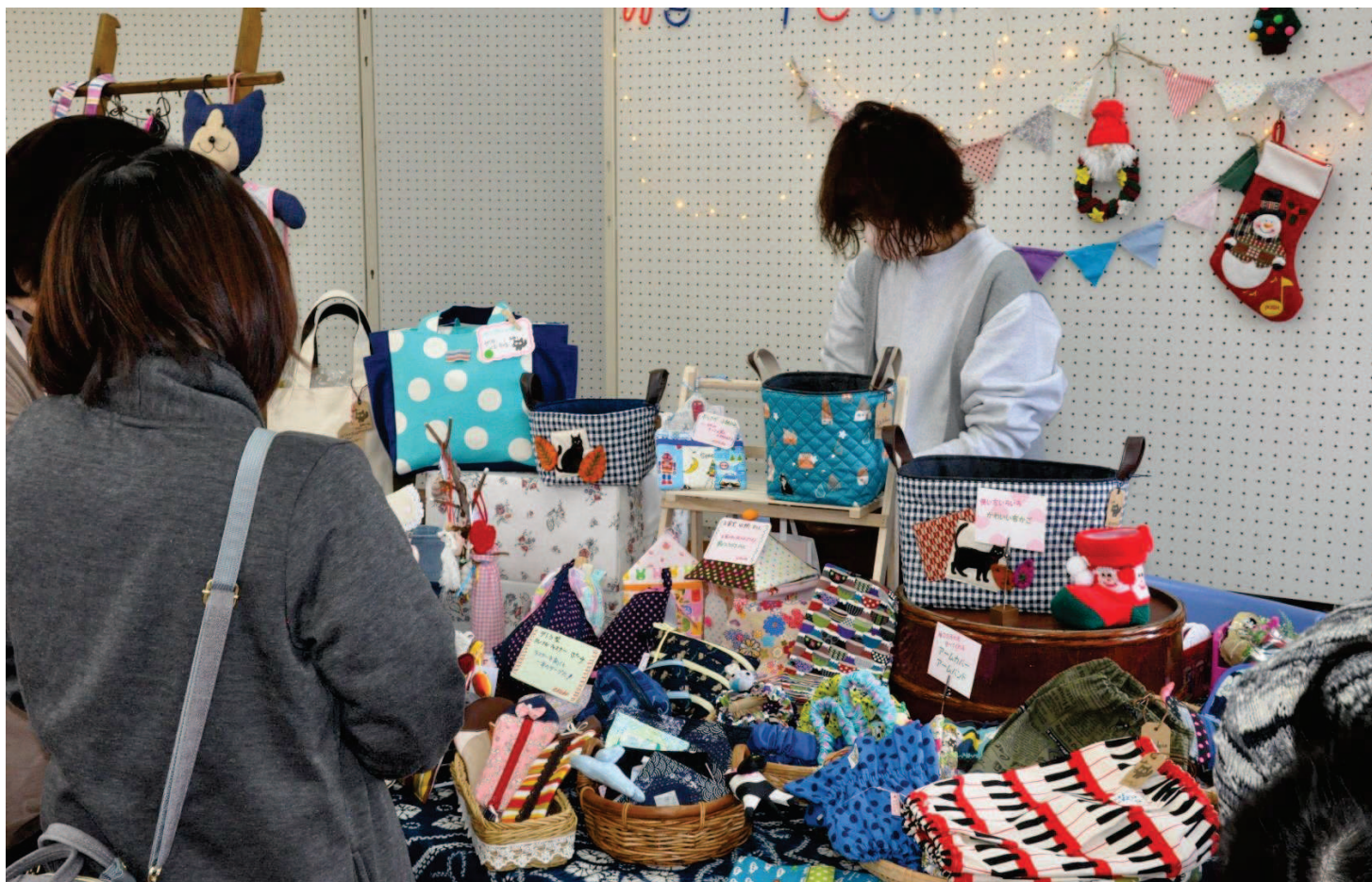
↑展示も華やかで皆さん目移りしているようでした。