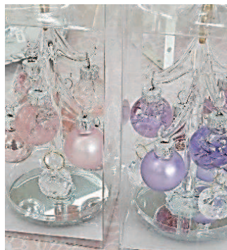
↑ハーバリウムのガラスツリー。クリスマスシーズンにぴったりですね。