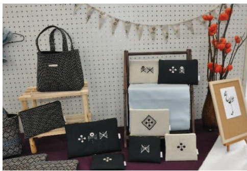
↑シックなデザインのポーチやバッグが並んだこのコーナー。「何を入れようかな～」と考えながら品定めをするのも楽しみの一つ。

ハンドメイド作家さん達のこだわりの作品がたくさん 並んだ癒しの空間をご紹介します。