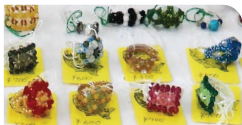
→ビーズアクセサリーコーナーでは、カラフルなリングやネックレス、ブレスレットが並びました。