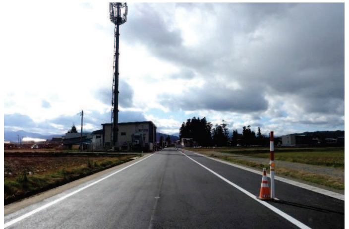
左側の建物は㈱ミユキ精機、道路奥右側の杉林は毘沙門堂。市道毘沙門天上小瀬線の一部区間ですが、広くなりました。上記の写真撮影時の12月14日は雪が降っていませんでした。