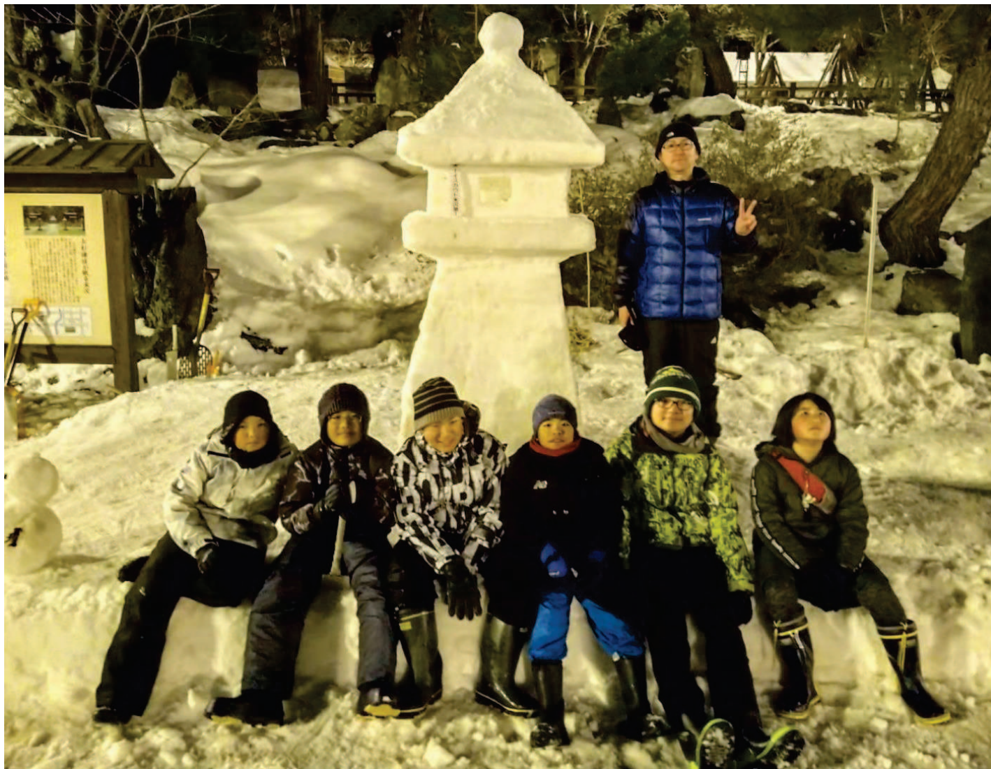
完成した雪灯籠の前でパチリ。皆さん満足して嬉しそうでした。小さいかわいい雪だるまもなごみます。