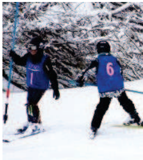
こちらはポールセット風景。コ ーチ陣が見守る中、子ども達が 協力して行います。

そんな保護者と子供たちに支 えられながらアルペンチームの 活動を続けていきます。