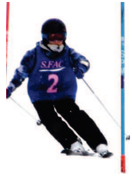
広いゲレンデでのびのびと練習に励んでいます。

また自分が上達する事に純粋な 喜びを感じながら、指導者と子 供たちが一緒になって練習をし ています。