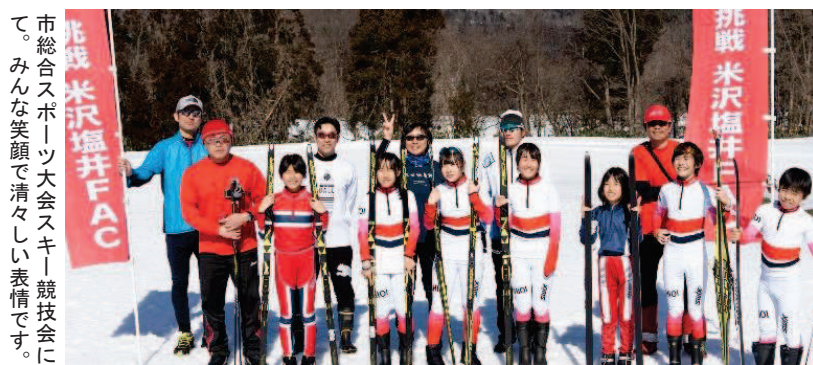
市総合スポーツ大会スキー競技会に て。みんな笑顔で清々しい表情です。