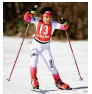
全力でレースに臨んだ皆さん に熱い声援も飛び交います。

きました。 そして、何より素晴らしい と感じたのは、仲間への精一 杯の応援でした。 そんな仲間思いのクロカ ンチームですが、今後もスポ ーツを楽しむことを忘れず、 地域に笑顔と活力を与えら れるよう元気に活動してい きたいと思えます。