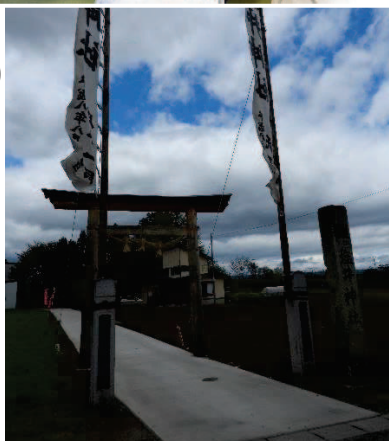
約70mの白い参道が青空によく映えていました。 令和6年4月25日(木)撮影。

今年も、住民の皆様との安寧と、豊作と健康を祈って、祈年祭を無事に終わらせることが出来ました。」との言葉をいただきました。