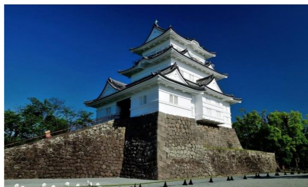
白壁も美しい小田原城。公式小田原城難攻不落の城より。