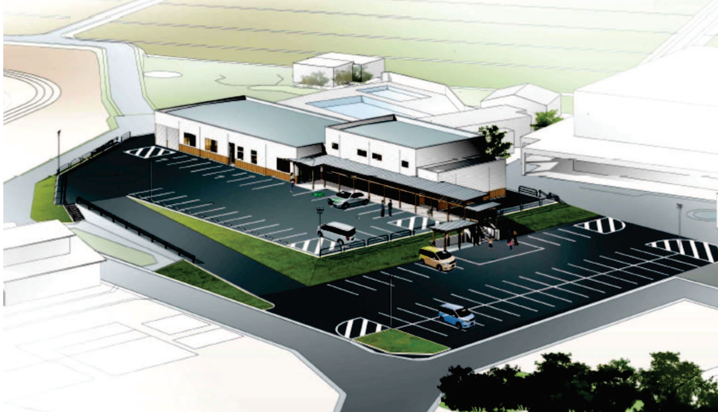
2024.4.1 現時点でのイメージです。