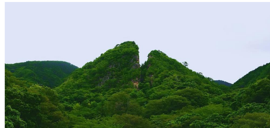
佐渡金銀山。

今年の研修旅行は、夏の初めに新潟県佐渡島にある佐渡金山を巡ります。ここは、日本最大の金銀山として、平成元年3月に資源枯渇のため操業を休止するまで、約400年にも及ぶ歴史があり、国の史跡や重要文化財指定の遺跡、重要な文化的景観選定箇所など、見所がたくさんあります。そのほか、佐渡島の中央部に広がる国中平野の東側、新穂地区にある「トキの森公園」へも向かい、トキの生態を観察できる「トキふれあいプラザ」などを見学します。