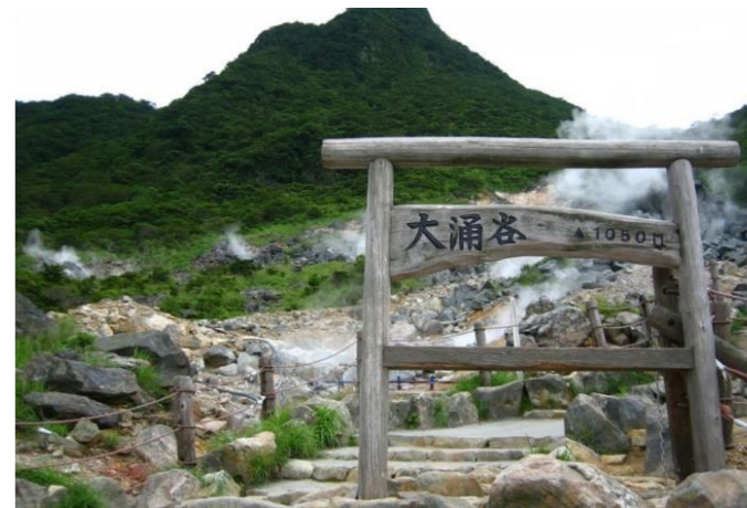
箱根名物大涌谷(おおわくだに)。

味噌作りのプロからおいしい手作り味噌を習いませんか。また、筆ペンの奥深く楽しい世界を体験してみませんか。羽子板などに代表される日本の伝統的な手芸、押絵。繊細で立体的な絵柄「ふくろう」を作ってみませんか。