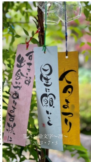
筆ペン絵文字の短冊。