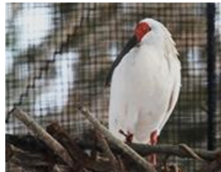
トキの森公園の朱鷺(トキ)。