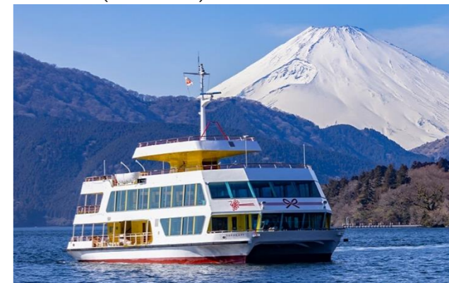
箱根遊覧船 SORAKAZE。